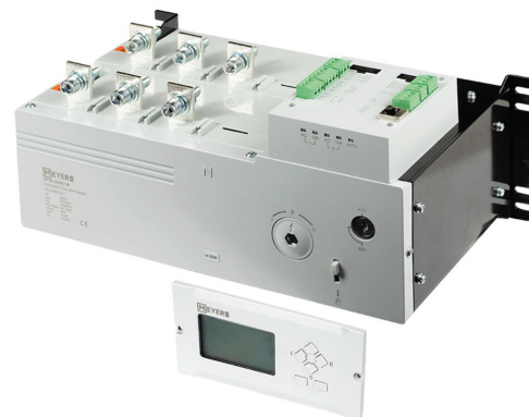
ATS2 250A 3P